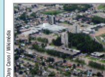
Dany Casari / Wikimedia

Philippe a consulté le site http://html.net/tutorials/php/